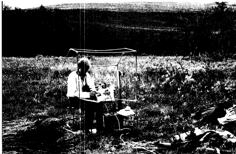
Skärskådning av ett av Post-LUVREs högteknologiska äventyr. I ett av LÖVRE inlånat barnkiosktält trängdes ivriga Post-LUVRingar med brummande apparatur och surrande mygg, för att studera blåhakars slakt på oskyldiga mjölmaskar (Mats Grahn, "Myren", augusti 1987).